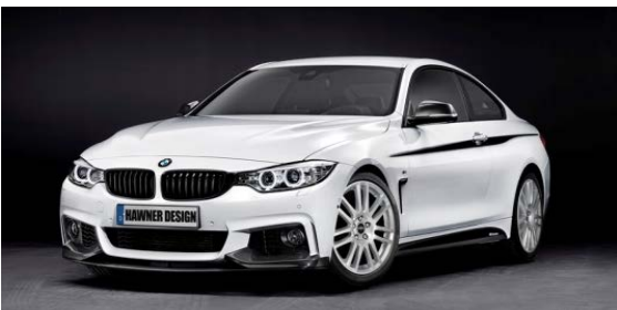
話題の新型BMW装着イメージ

56) サイズも追加され、好調のハウナーW07は今年のウィンターシーズに一押しの商品です。