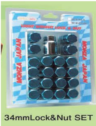
34mm Lock & Nut SET

モンツァブランドで新しく発売することになりました。カラーは全8色となり20個セットのロックナットセットと16個セットの軽自動車用ショートナット(27mm)セットの2パターンとなります。定価は20個セットが10,000円(税別)、16個セットが9,000円(税別)で、詳細は今年の冬季カタログ7ページ、もしくはモンツァホームページに掲載されておりますのでご利用をお待ちしております。